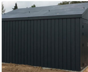
ZINK-MAGNESIUM- VERKLEIDUNG MIT SATTELDACH