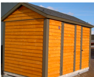
HOLZVERKLEIDUNG MIT SATTELDACH