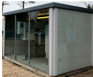
LAY LIGHT FIBERLINE VERKLEIDUNG