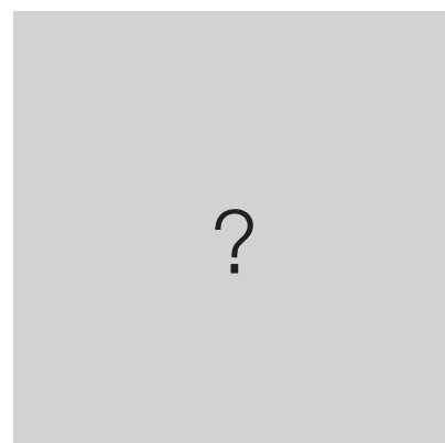
SPECIELLE ØNSKER? - kontakt os gerne.