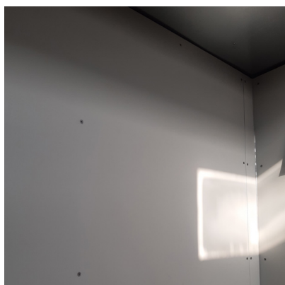
MELAMIN LYS- GRÅ